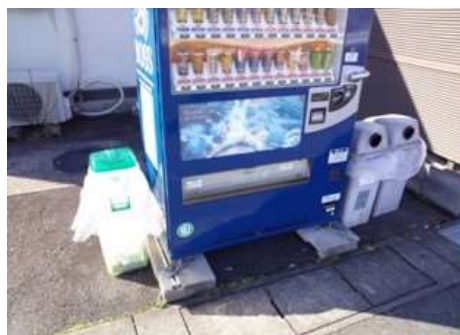
エコキャップ運動の参加