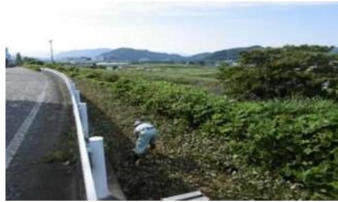
近隣道路 草刈・清掃