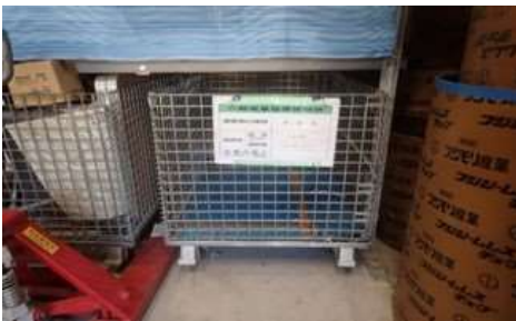
段ボール・紙類 再資源化 分別の実施