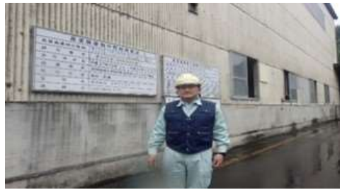
産廃処理場(リサイクルクリーン) 視察状況