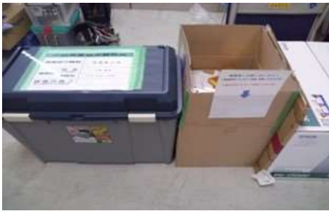
事業用廃棄物の分別