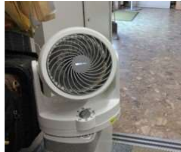
エアコンとサーキュレーターの併用 (2023年7月導入)