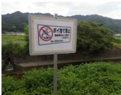
近隣道路 ポイ捨て禁止の掲示