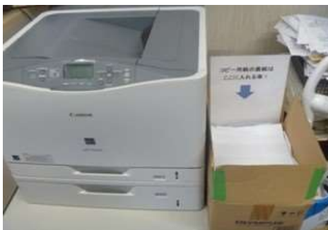
コピー用紙の裏紙使用