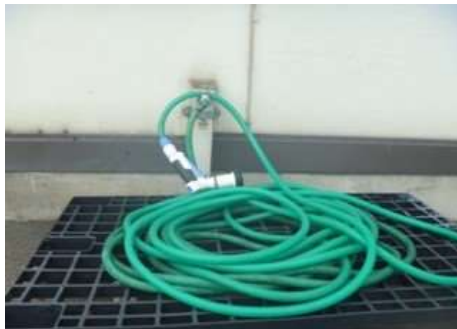
ストップガンの取付