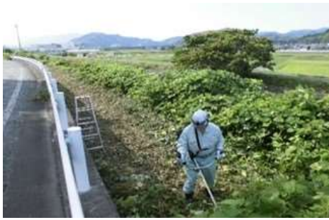
近隣道路 草刈・清掃