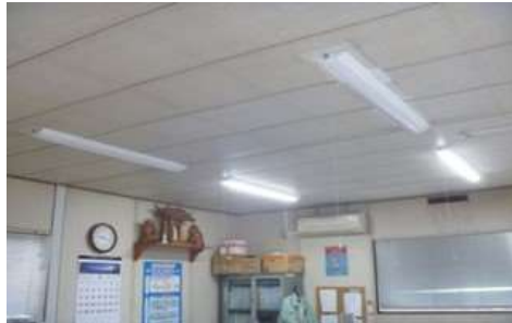
LED照明の導入・プルスイッチ化 無人エリアの消灯